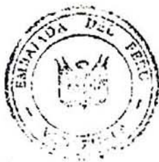
ALLAN WAGNER TIZON Embajador

Expreso a Vuestra Excelencia las seguridades de mi más alta y distinguida consideración.