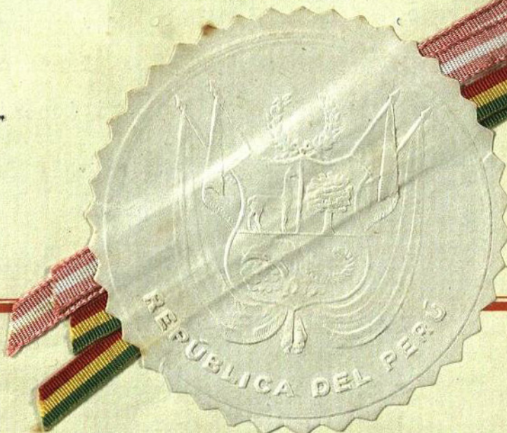
WALTER GUEVARA ARZE, Ministro de Relaciones Exteriores y Culto de Bolivia.